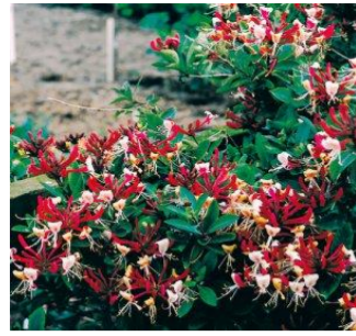
Lonicera Serotina (Kamperfoelie)