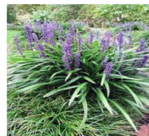
Liriope muscari, leliegras