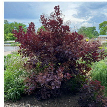
Cotinus coggygia 'Royal Purple'