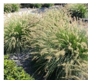
Pennisetum alopecuroides 'Little Bunny'