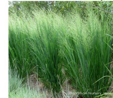
Panicum virgatum Northwind