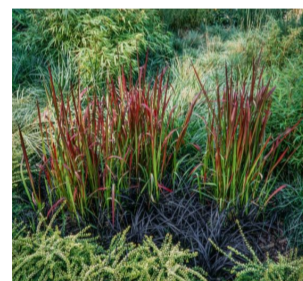
Imperata cylindrica 'Red Baron'