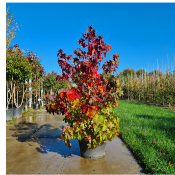
Liquidambar styraciflua Worplesdon